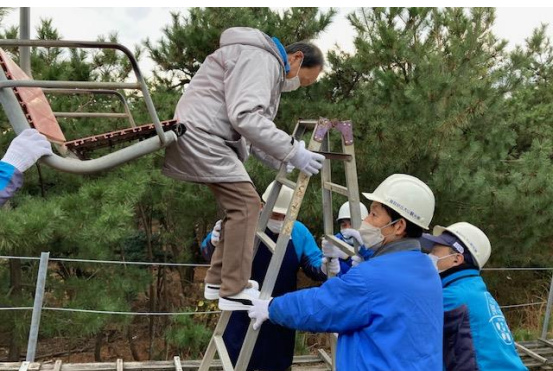
安全に乗客を搬器から降ろす