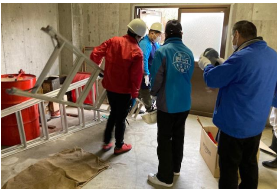
脚立を持って迅速に救助開始