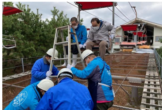
足場を安定させる